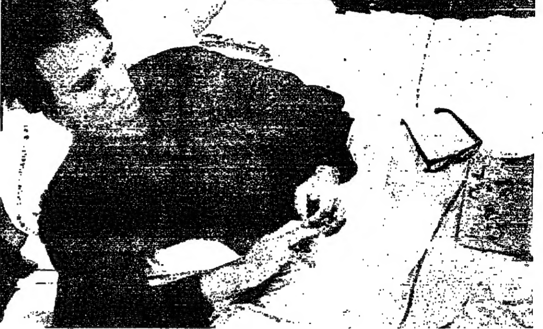
علي فرائض المرض